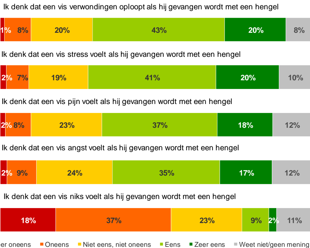
Figuur 3: Stellingen bewustzijn pijnervaring vissen (n=1.024)